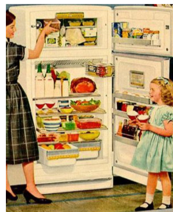
Immer gut gefüllt: der Kühlschrank in der Werbung der 50er Jahre

Ob E-Herd, Schnellkochtöpfe, Thermoskanne oder Brotschneidemaschine – alles war darauf ausgerich-