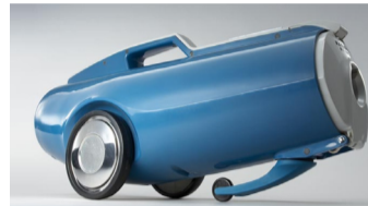
Ein Staubsauger wie ein Rennwagen (1965)

und Innovationen für den Haushaltsbereich permanent beobachtet und Vieles mit Begeisterung