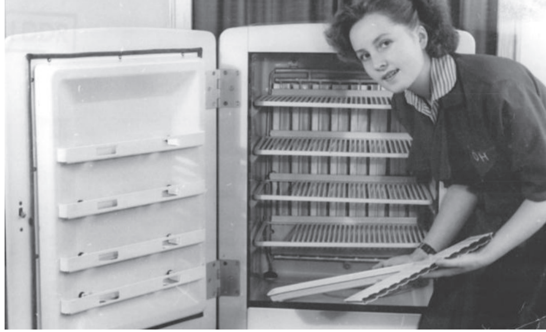
Mit wenigen Handgriffen die Vorteile erklärt: Verkaufsdemonstration 1953

Sogar die seltenen Exemplare, bei denen die Erziehungsversuche fruchtlos blieben, können sich heute wohl kaum noch einen Kühlschrank ohne 3-Sternefach für die Tiefkühlpizza vorstellen. Und eine stilvolle Küche wäre ohne trendige Kaffeemaschine und Edelstahl-Toaster auch für den Haushaltsmuffel undenkbar. In seiner 50jährigen Erfolgsgeschichte hat Badje-Ott die zahlreichen Trends