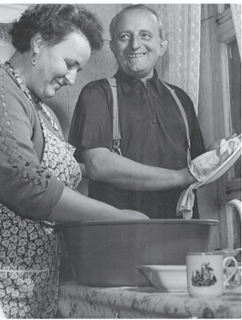
Als der Abwasch noch Teamarbeit war...

...sagt mein Mann“ sang Johanna von Koczian 1977 ins Schlagermikrofon. Die Ironie war unüberhörbar.